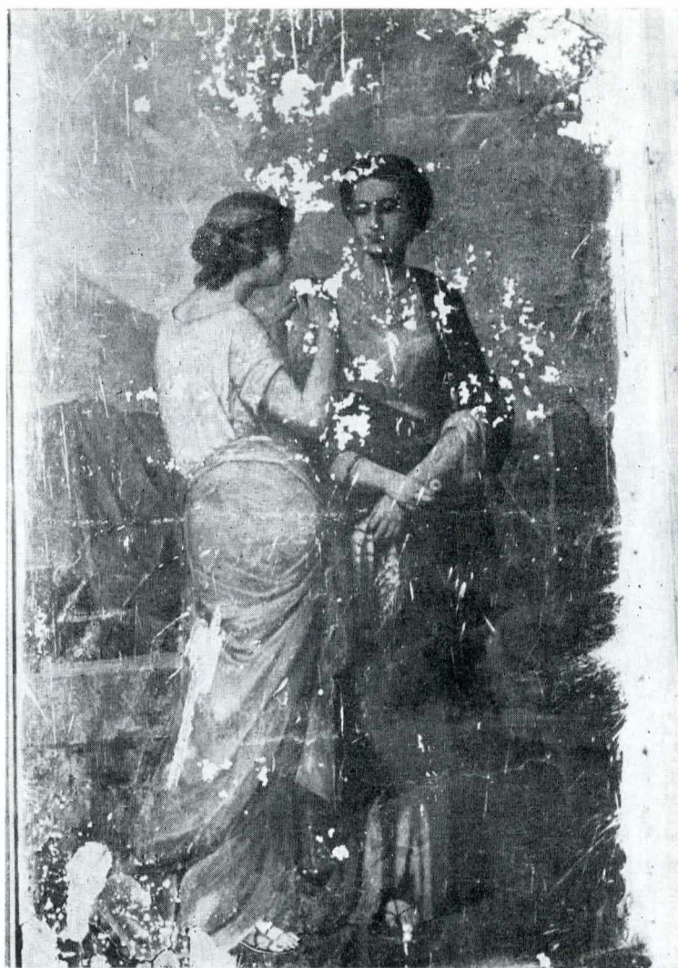
Fig. 4 — Anonim, „Scenă mitologică”.

ca pandant, un peisaj (complet distrus, păstrîndu-se doar vagi urme de culoare) și o compoziție — Doamna cu floarea (2,30 m × 1,29 m).