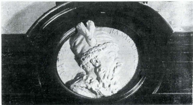
Fig. 9 — Ioan Georgescu, „Matei Basarab”.