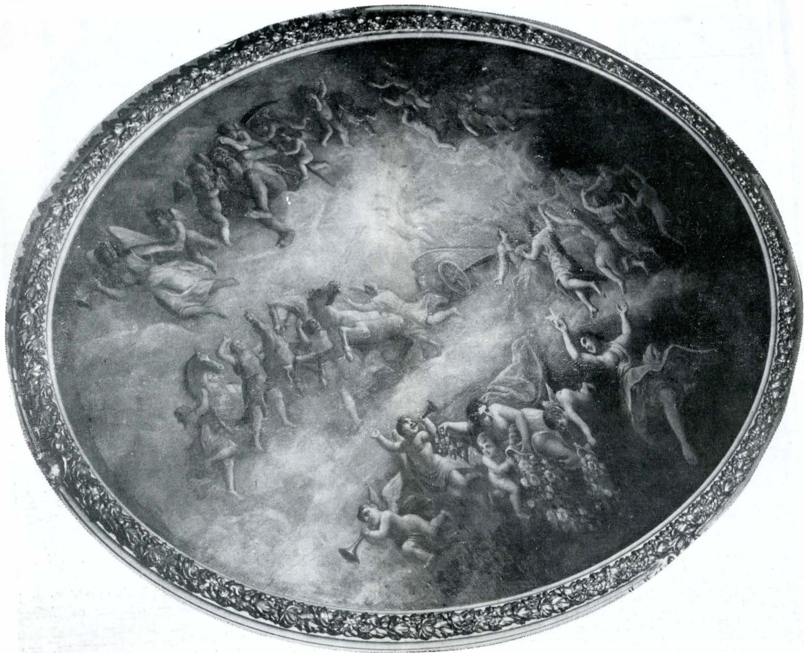
Fig. 5 — Anonim, „Apotheoza lui Apollo”.