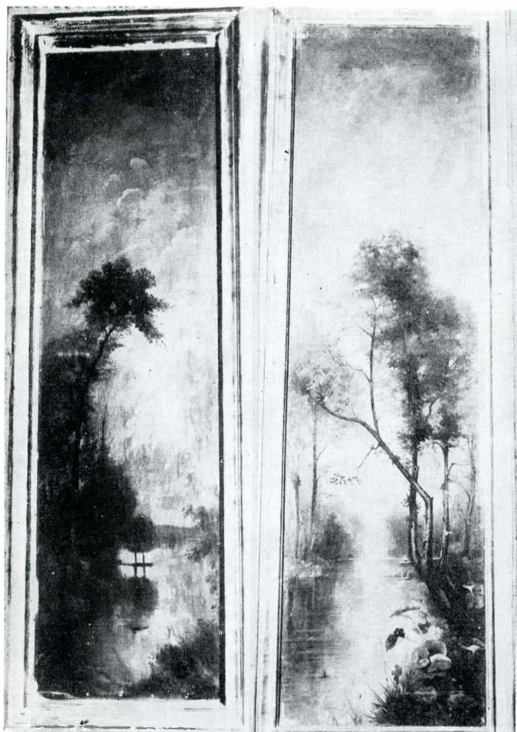
Fig. 3 — Anonim, Peisaje.