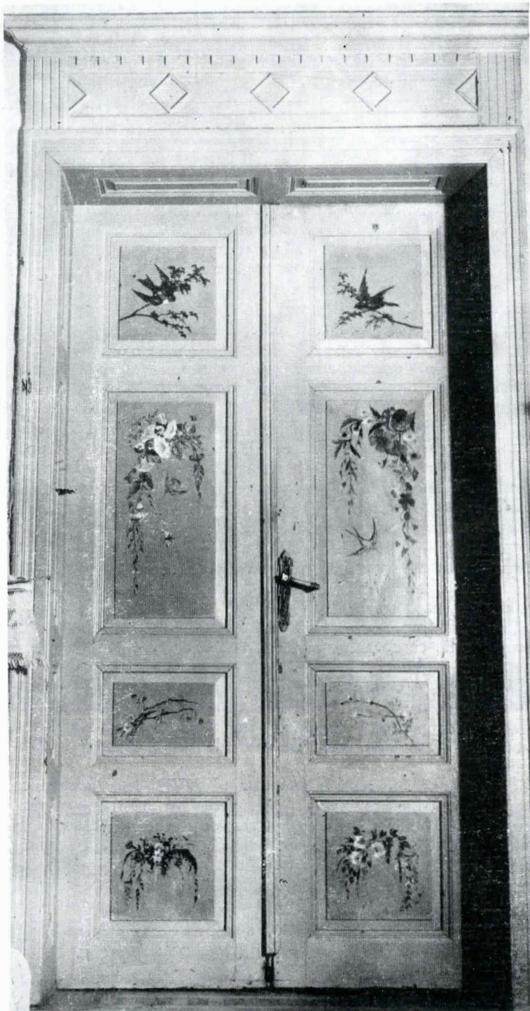
Fig. 11 — Ușă pictată. (Ilustrația articolului a fost executată de Irina Ghidali).

Nota red.: Rugăm pe cercetătorii care mai cunosc asemenea case, în București sau în provincie, să ni le semnaleze fie direct redacției în scurte note sau articole însoțite de fotografii, fie să le semnaleze autorului acestui articol, la Muzeul de artă al R. S. României. Str. Știrbei Vodă, nr. 1.