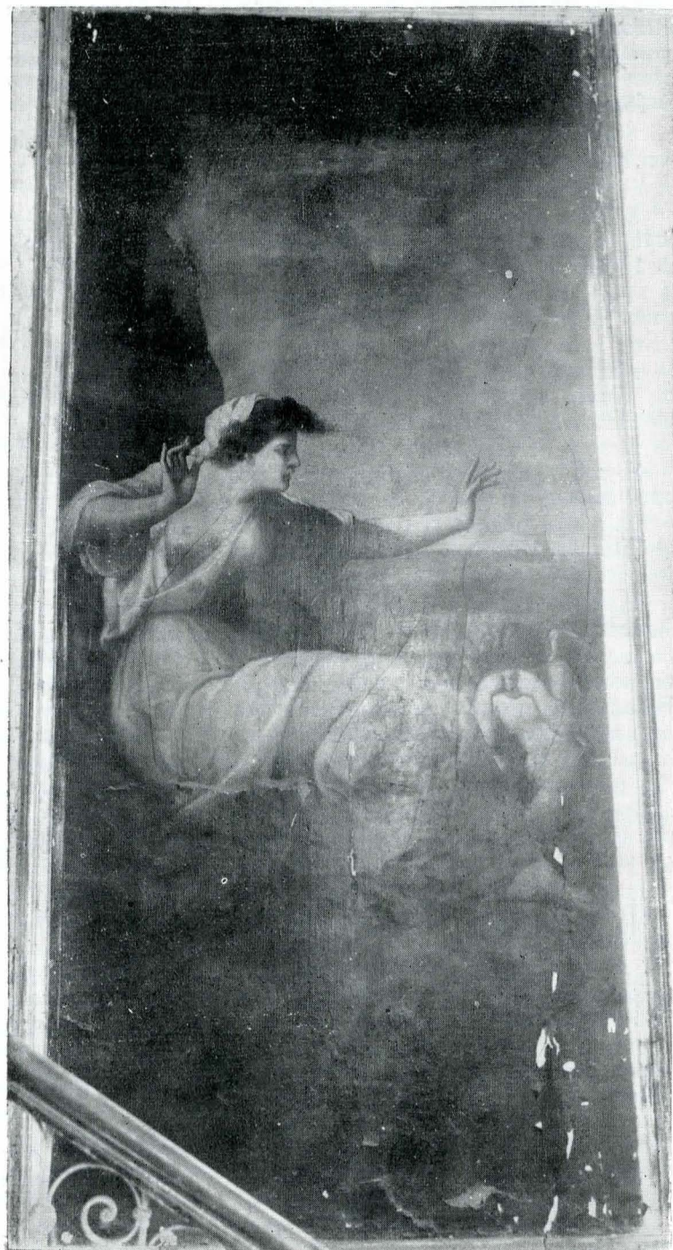
Fig. 1 — S. H. „Circe părăsită de Ulise”.